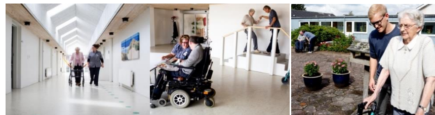
Revideret august 2022