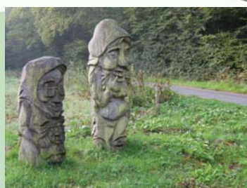
Træfigurer ved Skovlyst Naturskole