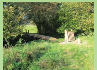
Trampesti til Årup Skov

I fjorden kan man måske få øje på en sæl, marsvin eller måske en hval. Turen går desuden forbi lystbådehavnen, den fine strandpromenade, hvor der er gode muligheder for badning, fiskeri og vandskisport. På Sønderstrand er der anlagt en sti med fast belægning og en handicapvenlig badebro.