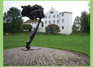
Brundlund Slot og skulpturen Vækst