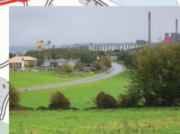
Udsigt fra den nye trampesti til Arup Skov