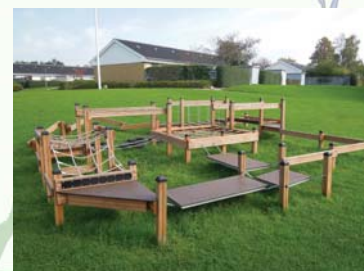
Motions- og legeredskaber ved Hørgården