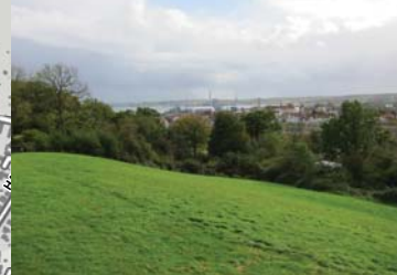
Udsigt fra Galgebakken