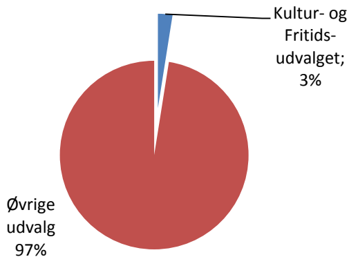
Andel af kommunens samlede driftsbudget