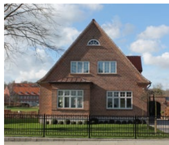
Gamle Kongevej 35, 1933. Muret øregesims, gavlkvist og karnap. Halvbuet vindue i gavlen efter klassicistisk ideal.