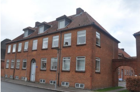
Den kommunale boligbebyggelse, Callesensgade 21-25, er tegnet af Jep Fink som en samling af helstøbte, klassicistiske bygninger med detaljer som portåbninger med kurvehanksbuer til gården, og nyklassicistiske hoveddøre med rundbuede overvinduer båret af tværposte med tandsnitsfrise.