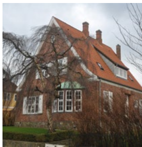
Callesensgade 1, 1912. Den sluttede bygningskrop med velproportionerede detaljer som karnappen, taksekvissten og vinduerne med skodder er et godt eksempel på Heimatschutz/hjemstavnsstilen. Mange af trækkene kan også betragtes som typiske for Bedre Byggeskik