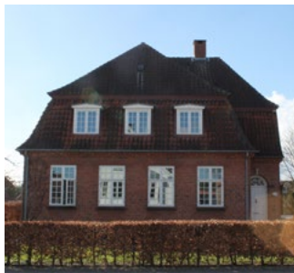
Callesensgade 8, 1929. Fin sluttet bygningskrop, med mansardtag og symmetrisk og rytmisk vinduesplacering.