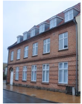
Vestergade 20, 1929. Nedre murværk er muret med refendfuger og fin dørportal, hertil murede gesimser.