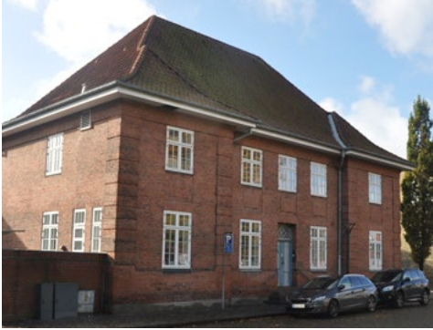
Kirkepladsen 2, 1909. Den tidligere præstebolig er symmetrisk opbygget omkring den centralt placerede hoveddør. To fremskudte sidepartier, siderisalitler, med murede kvadrejhjørner. Døren i Louis Seize stil er klart inspireret, hvis ikke genbrug, af byens døre fra slutningen af 1700-tallet.