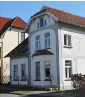
Forstalle 27, 1909. De pudsede dekorationer i tysk/ungarsk jugend stil. Schweizertag/udhæng og nationalromantisk gavlf med bindingsværk.