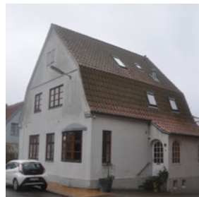
Møllegade 11, 1913. Heimatschutz/hjemstavnsstilen kendetegnes ved mansardtaget med røde vingeteg, karnappen og det fremskudte sideparti med den rundbuede indgang.