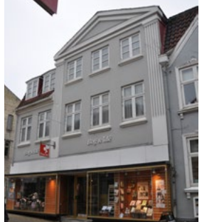
Ramsherred 28, 1920. Nyklassicistisk pudsarkitektur med fremskudt gavlkvist, med kannelerede pilastre.