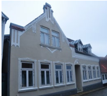
Lille Pottergade 3, 1904. Vinduesindfatninger og dekorationerne langs gesimserne har jugendpræg.