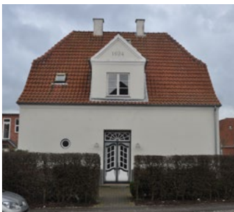
Svinget 3, 1924. Fin bygningskrop med halvvalm og symmetrisk placerede skorstene i tagryggen. Hoveddøren er i et nybarokt udseende. Kvist med klassicistisk forbillede.