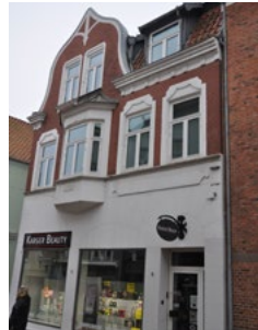
Storegade 20, 1906. Jugendstilen ses på karnappen og gavlkvistens pudsdekoration.