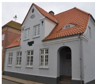
Sønderport 6, 1913. Med flægermusekviste i taget ses stiltæk fra hjemstavnsstilen. Den symmetriske gavlkvist og husets sluttede form med halvvalm er i bedre byggeskik.