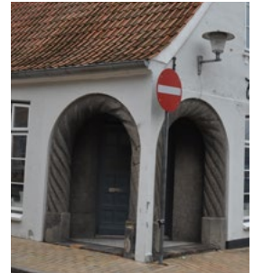
Skibbrogade 23, hjørneudformningen fra 1920 er udført i den danske pendant til jugend; skønvirke.