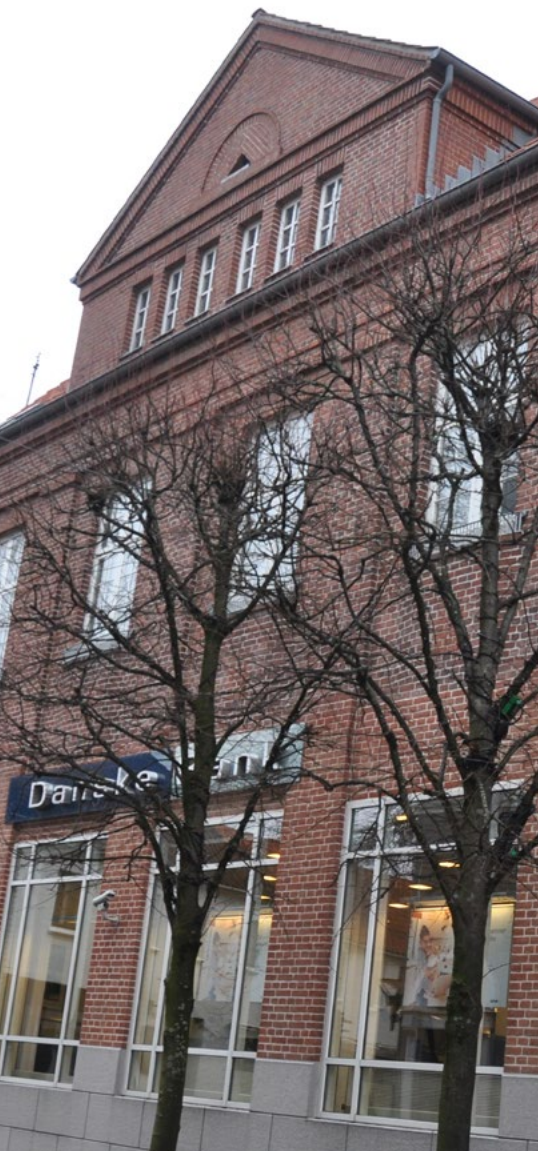
Storegade 3, er opført i 1915 i nyklassicistisk stil med en rytmisk facade med let fremskudte murede pilastre og en stor centralt placeret rytterkivist med trekantfronton.

Med hjemstavnsstilen og Bedre Byggeskik havde byggetraditionen i det nordlige Tyskland, Slesvig-Holsten og i Danmark nærmet sig hinanden så meget, at de nærmest var ens.