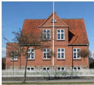
Forstalle 46, 1929. Symmetrisk hus i bedre byggeskik, lige stik over vinduer og centreret gavlkvist med halvbuevindue.