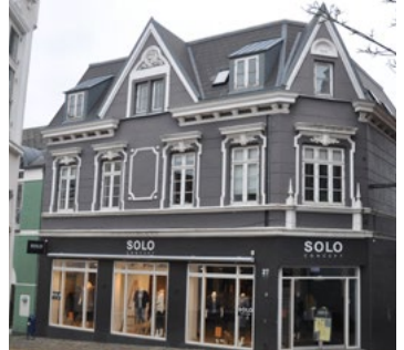
Ramsherred 27, 1901. Et primært historicistisk hus. Den brede schweizerinspirede gavlkvist, har dog pudsdekorationer med jugendstil.