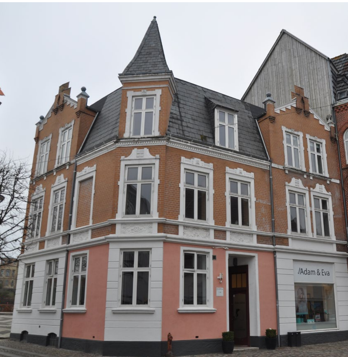
Nørreport 14, 1907. Tårn og stejl tagflade i schweizerstil, mens gavlkvistene peger mod nygotik. Jugendstilen markerer sig med dekorerede blændinger under vinduerne, med snirklede naturmotiver og blomstermotiver på vinduesindramningernes 'overliggere'.