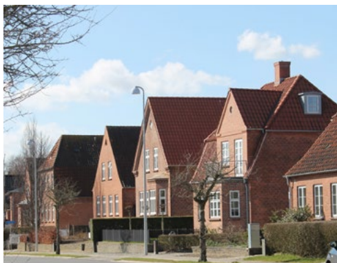
På Forstalle tegner de fritliggende huse fra tiden et fint gadeforløb. De sluttede bygningskropper er hver for sig fine eksempler på tidens bedre byggeskik, de 'indrammes' desuden af de lave forhaver.

Med opmålingerne finder de unge arkitekter primært forbilledet for 'en ny hjemlig bygningskunst' i Sønderjylland, - således har Heimatschutz/hjemstavnstilen og Bedre Byggeskik i og for sig samme inspirationskilde. Det fælles udgangspunkt for den nye mere nationalt inspirerede byggestil finder tilsyneladende helt tilfældigt sted. Den fælles inspirationskilde kan dog gøre, at det i dag er svært at se forskel på offentlige slesvig-holstenske og danske bygninger fra de