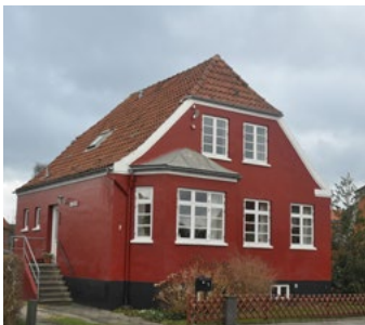
Callesensgade 7, 1923. Sluttet bygningskrop med halvvalm og øregesims. Karnap med skrå sider og kobbertag. Malerbehandlingen er nyere.