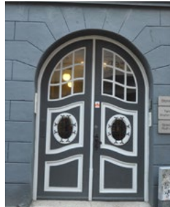
Storegade 7, 1907. Jugendperiodens bløde ornamentstil ses ved dørens bølgende udtryk.