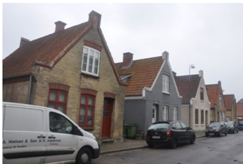
Lavgade 4-6 og 18-20, 1904. De fritliggende huse med nygotiske gavlmotiver er bygget som offentligt finanserede arbejderboliger. Byggestilen går mod Heimatschutz/hjemstavnsstil.