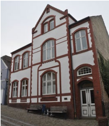
Ramsherred 8, 1904. Nationalromantikens gotiske og konstruktive formsprog blødes op af de mere bløde og rent dekorative linjer.