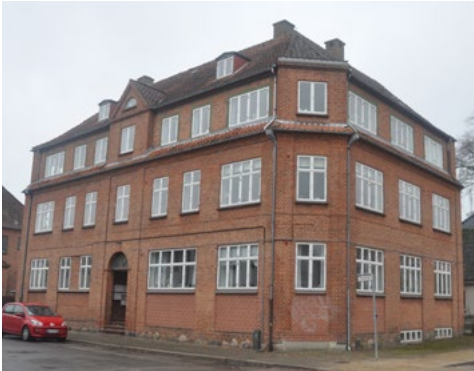
Lavgade 27, 1925. Symmetrisk og rytmisk bygningskrop med central placeret indgangsparti der understreges af gavlkvisten med fronton/trekant-motiv og det klassicistiske rundbuede vindue.