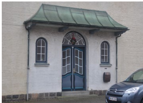
Svinget 1, 1927, dørens udtryk og det karnapliggende udhæng er inspireret af byens 1700-tals arkitektur.

Større byggerier i perioden bliver i deres udtryk langt mere præget af nyklassicismen end de regionale byggetraditioner som sådan.