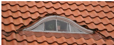
Sønderport 6, 1913. Flagemusekvist, der minder om de bryn der ofte ses på stråtage over små tagvinduer.