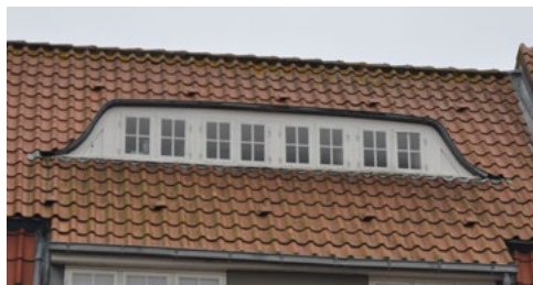
Vestergade 1, 1910. I den stejle tagflade tegner den langtrukne kvist med flagermus-flunker et fint velproportioneret bygningselement i tagfladen.

Mange af Sønderjyllands huse fra tiden, vil man i resten af Danmark, betegne som Bedre Byggeskik, mens man i Sønderjylland vil kalde stilen for sønderjysk/nordslesvigsk hjemstavnsstil.