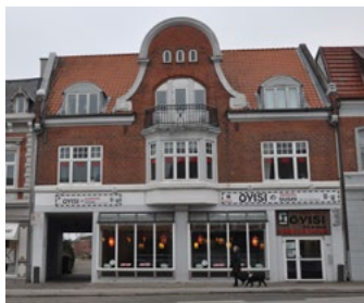
Nørreport 4, 1912. Med et gavlundtryk præget af jugendperioden, peger karnappen og bygningens symmetri mod Heimatschutz-stilen.