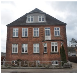
Callesensgade 17, 1924. Bygningen fremhæves af klassicistiske murede kvadre, fin tidstypisk karnap med skrå sider.