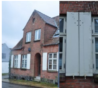
Barkmøllegade 3, 1912. Klare idealer fra den vestslesvigske byggetradition med den centrale gavlkvist, vinduerne med skodder og hovedindgangens buede stik.