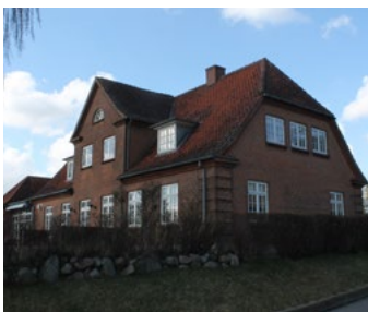
Bjerggade 8, 1927. De murede detaljer er fine på bedre byggeskiks huset med halvvalm, centralt placeret kvist og kvadremurede hjørner.