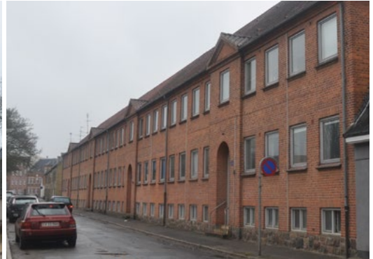
Lavgade 7-13, 1921. Bolig/lejlighedsbyggeri af Jep Fink i nyklassicistisk stil med enkel og ensartet facaderytme, der deles af de let fremskudte indgangspartier med gavlkviste med fronton/trekantmotiv.