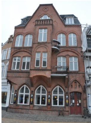
Nørreport 12, 1907. Nærmest nygotisk nationalromantik, men med jugend træk med karnappen, altanerne, det stejle tag mv.