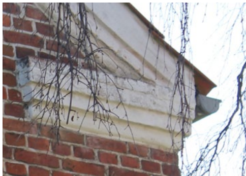
Callesensgade 1, 1912. Øregesims. Gesimsen under taget fortsættes ind på gavlen som et dekorativt element.

Husene ses ofte med opsprossede vinduer og hvide skodder. Fra den vestslesvigske byggeskik gentages vinduer med 6-8 ruder i hver ramme. Et typisk kendetegn for Bedre Byggeskik i hele Danmark er, at der bliver indført mere flade ruderformater, som ellers gennem stilhistorien har været usete. Sprosserne er fortsat tynde. Over vinduerne ses lige stik, dog er hoveddørens stik ofte buet, ligesom der kan være simple murede dekorationer herover.