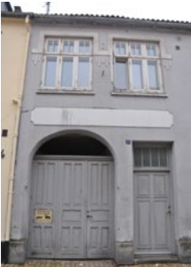
Skibbrogade 2, 1890. De enkle pudsdekorationer er tidlige tegn på jugend.