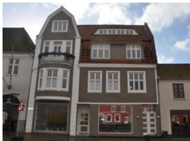
Vestergade 1, 1910. Med et facadeudtryk præget af jugendperioden og schweizerstilen, mens karnappen og taget med taskeskivst og herover flagemusekvisst præges af Heimatschutz-stilen.