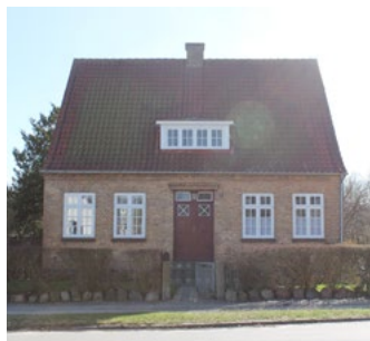
Forstalle 41, 1933. Symmetrisk hus i bedre byggeskik. Hoveddør, pultkvist og skorsten er centreret. Hoveddøren er markeret af en enkelt muret gesims.