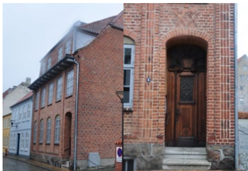
Store Pottergade 6, 1914. Repræsenterer med sin sluttede bygningsform, halvvalm og brugen af dekorativt mønstermurværk heimatschutz-stil, mens dørens detaljering er jugendstil.