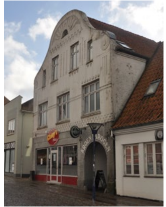
Vestergade 7, gavlen er opført omkring 1905 med pudsdekorationerne i jugendstil.