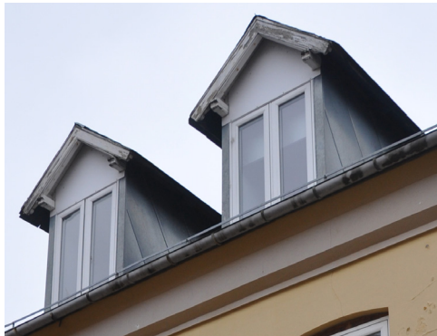
Ramsherred 23. Kvistene stammer nok fra opførelstidspunktet 1900, de er senere istandsat og ændret. Der ses stadig schweizerstil i bjælkenernes profilering