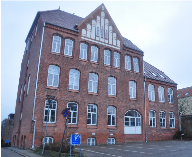
Den gamle borgerskole, Rådhusgang 4. 1907, arkitekt Friedrich Jablonowski.