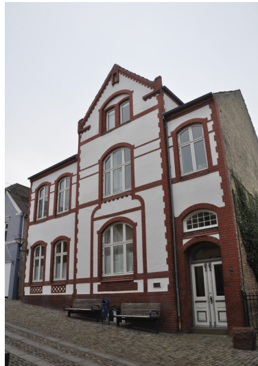
Ramshered, 1904. Pudsede flader og detaljer i blank mur, peger i sit udtryk mod jugendstilen.