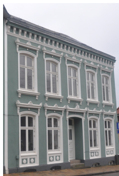
Nybro 14, omk. 1800. Facaden er formentligt istandsat o. 1900 hvor mere detaljerede overliggere mv. er tilført.