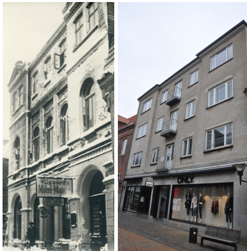
Storegade 5, opført 1887 og senere ombygget.