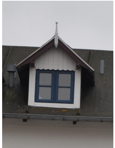
Fiskergade 3, 1900. Med opstander og udskårne bjælkeender er kvistene udført i schweizerstil