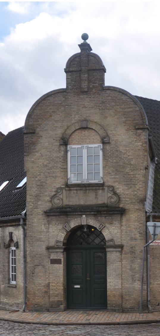
Günderoths Stiftelse, Nygade 46, 1860, tegnet af arkitekt L.A. Winstrup, med gavlkviste i nyrenæssancestil, nærmest en byzantisk kloster-stil. Rundbuede stik over dørene med formsten og detaljer af cement.

Historicismen, er en fællesbetegnelse for en europæisk arkitekturstrømning, der efterlignede de tidligere store arkitekturperioder og stilarter. Således hentes der i perioden fri inspiration fra renæssancen, gotikken, barokken mv.