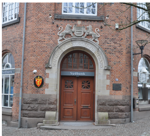
Storegade 18, 1911-12