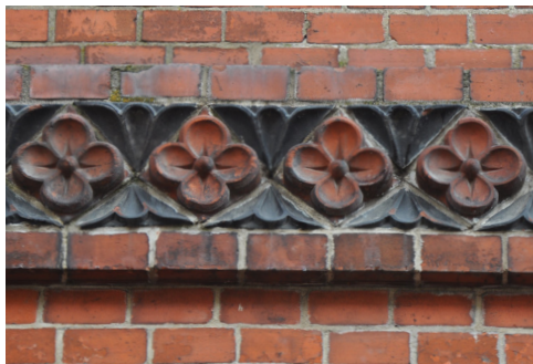
Skibbrogade 7, 1900. Murede frisebånd med sortglaserede formsten.