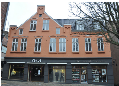
Storegade 5, 1900. Nygotiske kamtakker med hængestavsblændinger på gavlkvisten. Underetagen er kvadrepudset.