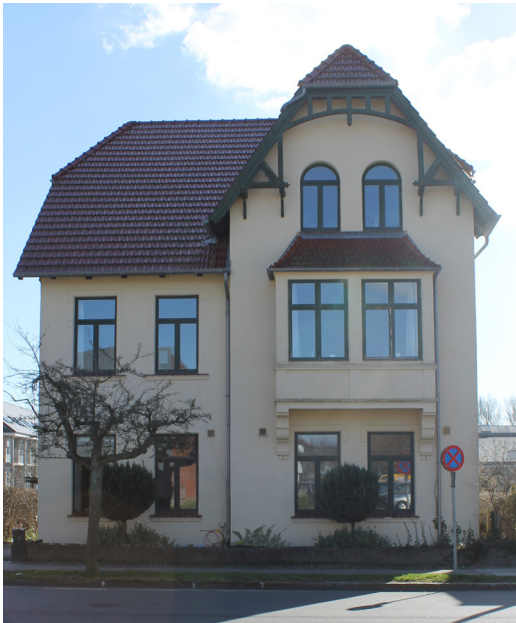
Forstalle 25, 1907. Taget og gavlkvisten med udskåret snedkerværk er karakteristisk for perioden.