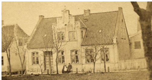
Kirkepladsen 5, opført i 1859 med flere nygotiske træk. Huset blev ombygget i midten af 1900-tallet og tilbageført for få år siden. Kamtaket gavlkvist med hængestavsblændinger. På billedet til højre ses også spir, samt skorsten med murede dekorationer.