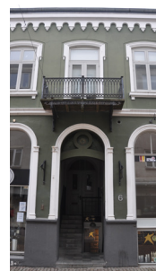
Storegade 6, 1867. Enkel pudsarkitektur og altan i støbejern.