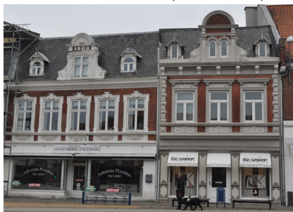
Nørreport 6 og 8, 1900. Murstensarkitektur med pudsdetaljer, dekorerede gavlkviste, schweizerkviste og stejle skifertage.