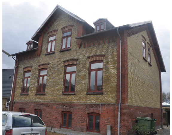
Møllegade 5, 1906. Opført i gewerkschulen-stil med mønstermurværk og murede detaljer. Schweizerstilen skinner igennem ved tagets store udhæng og gavlspærenes profilerede afslutninger.