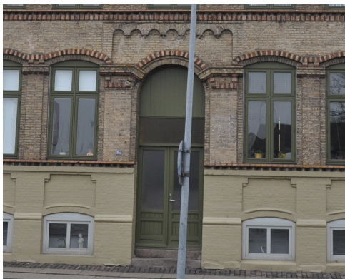
Nyvej 3, rundbue motivet ses brugt som en blanding over hoveddøren og understreger derved indgangen.