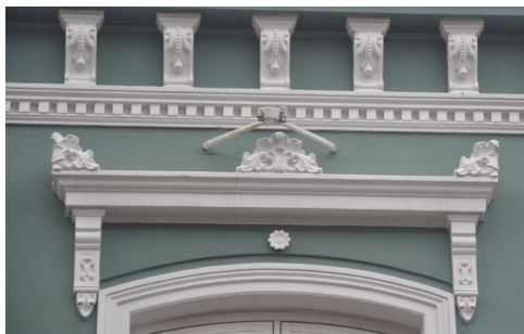
Nybro 12, huset stammer formentligt fra o. 1800. Vinduesindfatningerne er senklassicistiske, mens facaden i øvrigt er rigt dekoreret med overliggere over vinduerne, konsoller og frisebånd med tandsnit fra omkring 1900.