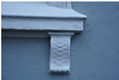
Nørretorv 1, pudsdekorationer stammer fra ombygningen til 'Bahnhofhotel' i 1865. Konsollerne med buedekorationer under sålbænke er muligvis tilført senere.