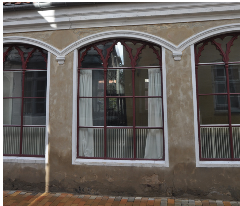
Slotsgade 24, ombygget 1852 hvor der er indsat støb-jernsvinduer med detaljeret spidsbue-motiv.