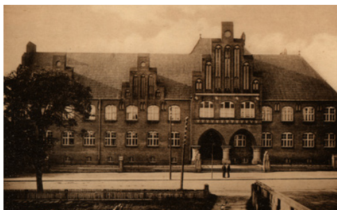
Det tidligere domhus er efter 1945 rensat for de nygotiske detaljer. Dette sker delvist som en reaktion mod den tyske periode, og delvist som konsekvens af at huset delvist sprænges i luften i forbindelse med Schalburgtage.