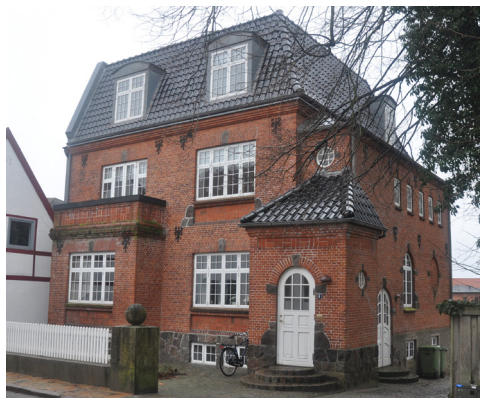
Nygade 4, 1908. Med klare danske nationalromantiske træk, viser brugen af mønstermurværk mv. mod Heimatschutz-perioden.