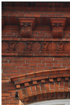
Søndergade 9, omk. 1900. Dekorativt muret bryn over vinduesstik og formstøbte sten til konsoller og frise.