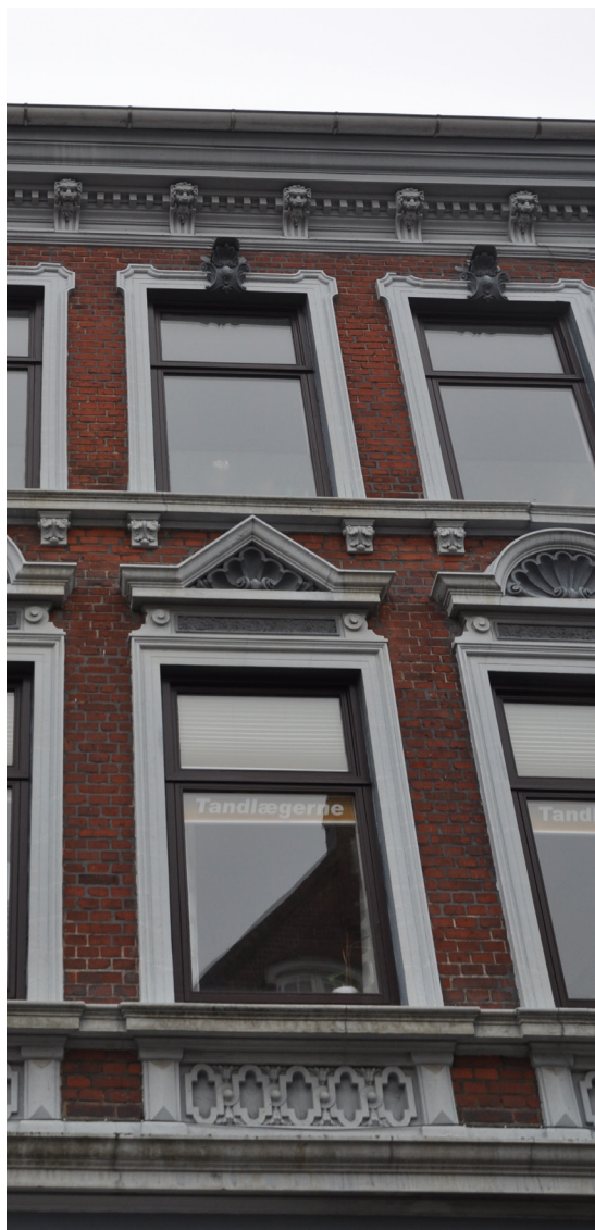
Ramsherred 18, 1899. Har en overetage i blankt murværk, dekoreret med pudsdetaljer og figurer. Der ses barokke rocaille(muslinge)motiver i de klassicistiske frontoner over vinduerne og på gesimsen ses motiver af gotiske dyremasker.

Historicismen som periode står således som en direkte frigørelse fra klassicismens bundne og stringente formsprog. I tiden ses det at hoveddørene flyttes væk fra den centrale placering i facaderne, ligesom gavlkvistene forskydes til yderfagene.