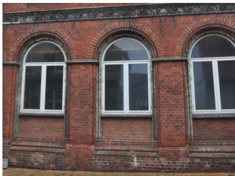
Nybro 10, 1880. Den nedre etage gengiver nærmest en åben arkade med de store vinduer der omslutes af søjler der bærer de rundbuede stik.