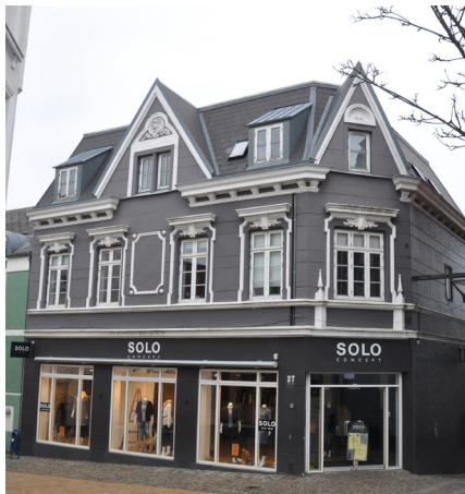
Ramsherred 27, 1901. De stejle gavlkvistes form er hentet fra schweizerstilen. Resten af husets dekorationer præges dog af pudsarkitekturens detaljer.