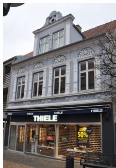
Ramshered 43, 1900. Et af byens mest dekorerede eksempler fra perioden med bl.a. en centralt placeret kvist, der afsluttes af en pudset renæssance gavl, rigt dekorerede søjlemotiver med bladdekorerede konsoller og rundbuede blændinger over vinduerne med skjold og plantemotiver.