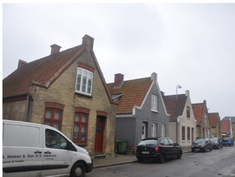
Lavgade 4-6 og 18-20, 1904. De fritliggende huse med nygotisk gavlmotiv er bygget som offentligt finanserede arbejderboliger. Byggestilen går mod Heimatschutz/hjemstavnstil.