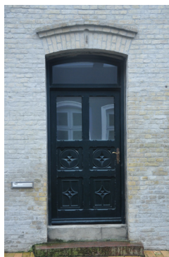
Store Pottergade 23