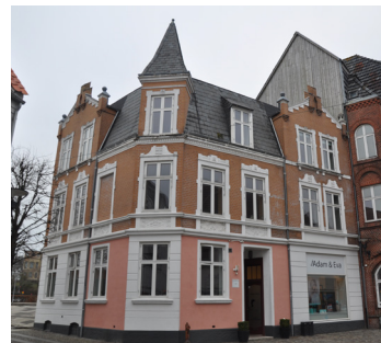
Nørreport 14, 1907. Historicismens stiltræk, med borgmotivet og pudsarkitekturen, ses ind i 1900-tallets byggeri. Her med et jugend inspireret tårn.