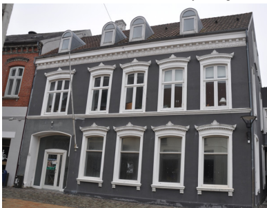
Nørreport 30, 1886. Et eksempel på periodens pudsarkitektur med den store detaljerede gesims.