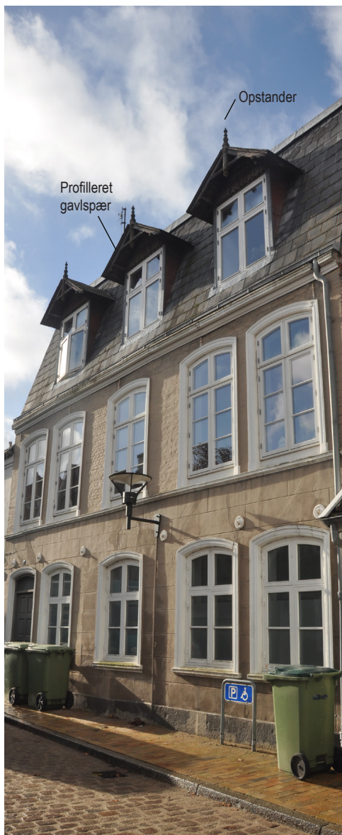
Nybro 22, 1898. Den stejle tagflade beklædt med naturskifer, kvistene med profilerede gavlspær og opstander er klare træk fra schweizerstilen.

Et af kendetegnene ved schweizerstilen er store og ofte stejle saddeltage med skifer eller med de nye falstagsten. Taget har ofte et stort tagudhæng, der skulle beskytte de kunstfærdigt udskårne snedkerdetaljer på facaden. Bygningerne prydes desuden af spir, tårne, eller høje gavlkviste. Hertil kommer de mange udskårne spær- og bjælkeender, og gavldekorationer med bl.a. opstandere.