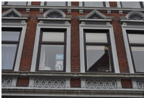
Ramshered 18, 1889

De oftest hvidtede detaljer på de pudsede facader skaber dynamik med stærke variationer mellem lys og skygge. Pudsdekorationerne ses både som simple indfatninger omkring vinduesåbninger, men også som detaljerede overliggere over vinduer og døre, dekorerede søjle- og pilastermotiver, og som udfyldning af blændinger over og under vinduer. Dertil kommer de rigt detaljerede konsoller som dele af hovedgesimserne eller bærere af sålbænke.