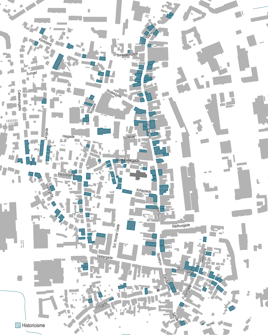
Historicisme og nationalromantik i Aabenraa. På kortet vises bebyggelser med gennemgående træk fra perioden.