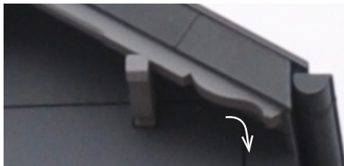
Nyvej 1a, opført 1877 har bevarede profilerede bjælker og spær. Profilet leder praktisk vandet væk og har kun ét dryp.