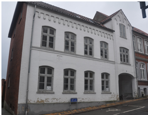
Nygade 54, 1865, af J.H. Callesen. Detaljer i historicistisk stil. Lisenerne omkring porten og fladbuefrisen under taget er udført i mursten. Gavlkvisten er forskudt til yderfaget.