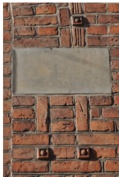
Storegade 18, 1911-12. Kehlede brændte fuger, kvadremotiv i pudset cement og dekorative formsten.