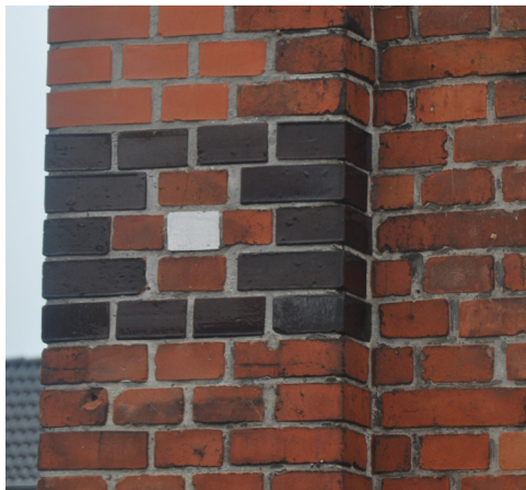
Klinkbjerg 9, 1900. Murværk med glaserede tegl