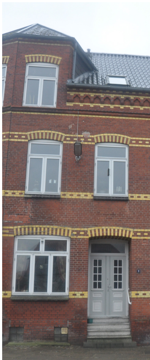
Forstalle 1, 1900. Udlejningsejendom opført i blankt murværk med mønstermurværk med gult glaserede tegl der markerer friser og stik. En gotisk spidsbuefrise danner gesims mod taget. Nyere berlinervinduer og historicistisk hoveddør.

Meget af historicismens arkitektur opføres af det offentlige, og etagebyggeri som udlejningsejendomme vinder samtidigt indpas. Således præger stilperioden særligt arkitekturen der bliver opført langs Lavgade, Forstallé og Callesensgade. Stilen benyttes også til ombygninger af de eksisterende huse, hvor gavlhuse får kamtakker og længehuse forhøjes.