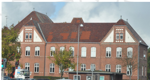
Det tidligere kreishaus, opført i 1902-04 i nationalromantisk stil.

Efter treårskrigen afslutning i 1850, ses de første gennemførte sønderjyske eksempler på historicistisk arkitektur opført som offentlig arkitektur. Günderoths Stiftelse, Nygade 46 fra 1860 tegnet af arkitekt L.A. Winstrup er et eksempel herpå.