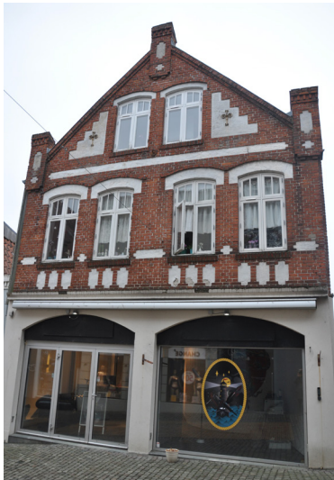
Ramshered 17, 1906. Historicistisk hus med nationalromantiske pudsede felter/blændinger.