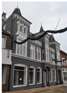
Søndergade 7, 1899. Borgudtryk, arkademotiv i stueetagen og pudsdetaljer.