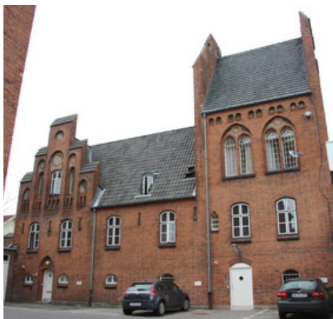
Arrestbygningerne bag det tidligere domhus. Haderslevvej 1-1a. Opført af Baurat Jablonowski med nygotisk forbillede; med røde tegl, kamtakkede gavle, stejle tage og spidsbuede vindues- og dørblændinger.

Gotikkens opadstræbende formsprog understøttes af tidens nye teknikker, hvor hjørnedekorationer og spir udføres i støbejern. Skorstenspiber stræber også gerne op efter, i enten høje smalle udgaver eller med afslutninger der illuderer kamtækker eller små borgtårne.