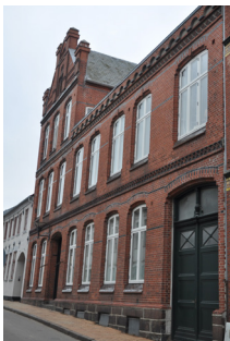
Skibbrogade 7, 1900. Historicistisk teglstensarkitektur.