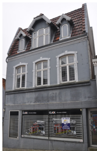
Ramsherred 13, 1800. Ombygget/forhøjet i historicismen.