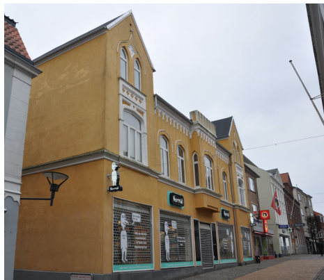
Ramsherred 51, 1857. Husets form har nærmest borgkarakter med de fremskudte sidepartier med gavlkviste og den centralt placerede karnap.