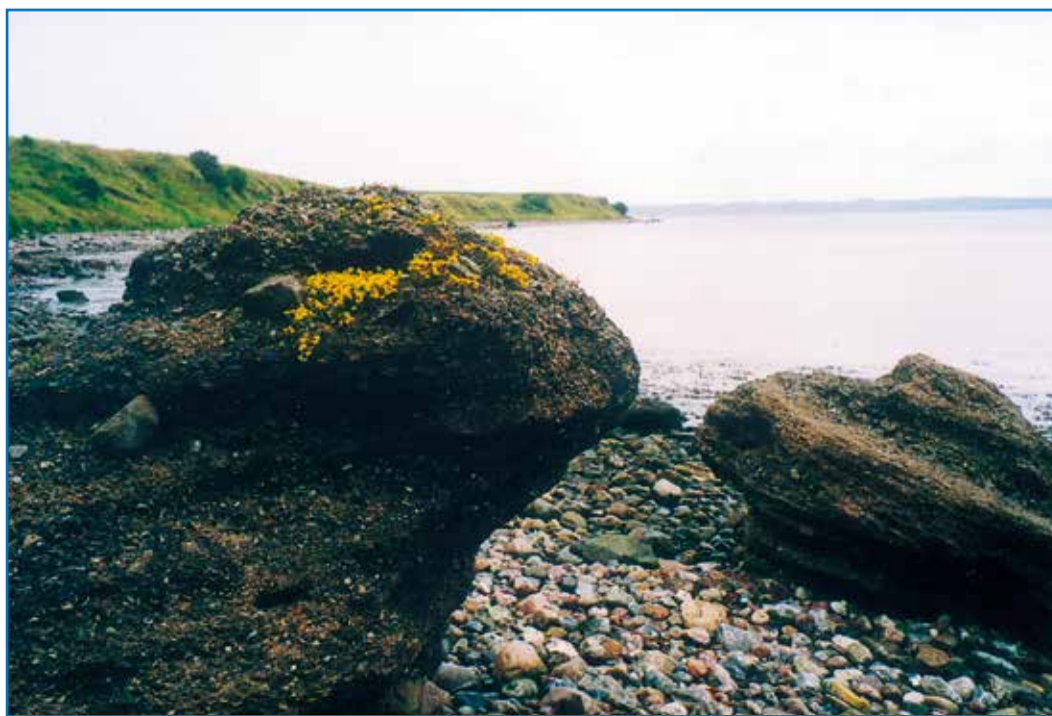
Kalksandsten ved Østerklev

Klippeblokkene ligger på stranden eller rager ud i skrænten. De består af sammenkittet grus og sten. De er dannet ved, at kulsyreholdigt vand har opløst kalken i de øvre jordlag for senere at udskille den i de dybereliggende gruslag. Her er det hele kittet sammen til en hård kalksandsten.