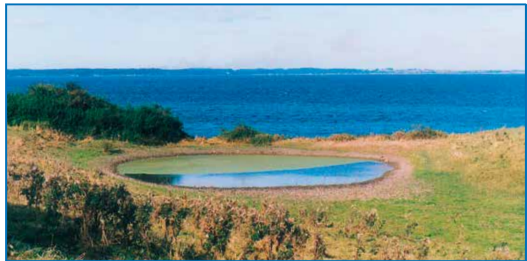
Udsigt over Rørsig

Gamle overleveringer vil vide at polske lejetropper, der i isvinteren 1659 gik over isen fra Fyn, gik i land på Barsø, hvor de kom i slagsmål med oboerne. Det var under Svenskekrigene. Slaget stod i det område på den nordlige del af øen der i dag kaldes Polakager.