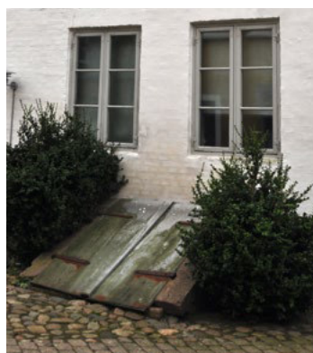
Kældernedgang med afdækning af skråstillede lemme, der hviler på trappens vanger.