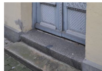
Fiskergade 1. To trappetrin i granit.