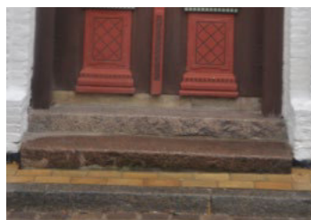
Nybros 14. To trappetrin i granit.