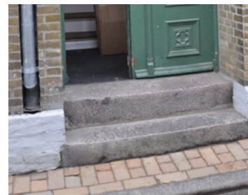
Gildegade 18. To trin der ligger 'i murværket' så de ikke skyder sig ud på gaden.