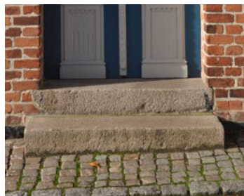
Kirkepladsen 6. To trin i natursten.