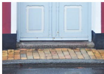
Vestergade 19. Trædesten.

Afvisersten er en sten, oftest en marksten eller mindre sten i granit, der beskytter hushjørner og porthjørner mod påkørsel. Hvor der findes afvisersten, bør stenene bevares. Stenede er ofte malede i samme farve som sokler.