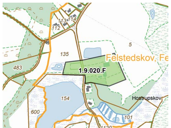
Nuværende kommuneplanramme 1.9.020.F