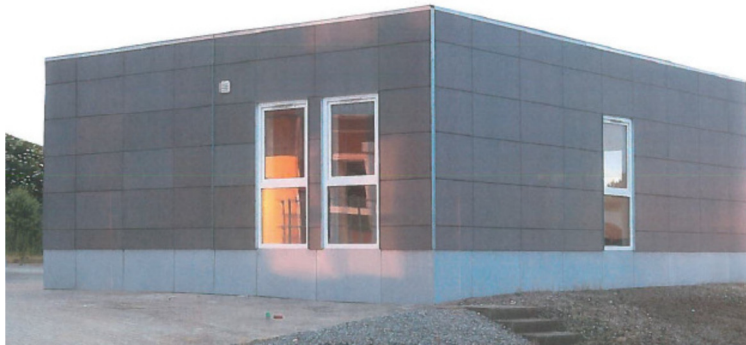
Referencfoto af lignende pavilloner sat sammen

Pavillonerne er ca. 3,6 m x 4 m x 10 m. Udvendigt beklædes pavillonerne med matte jævne antrazitgrå fiber-cement plader og tagpap på taget.