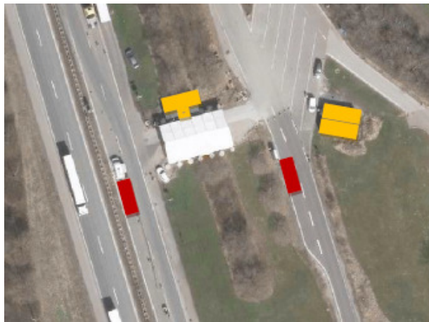
Gule felter er nye pavilloner, på eksisterende placeringer.

Pavillonerne er ca. 3,6 m x 4 m x 10 m. Udvendigt beklædes pavillonerne med matte jævne antrazitgrå fiber-cement plader og tagpap på taget.