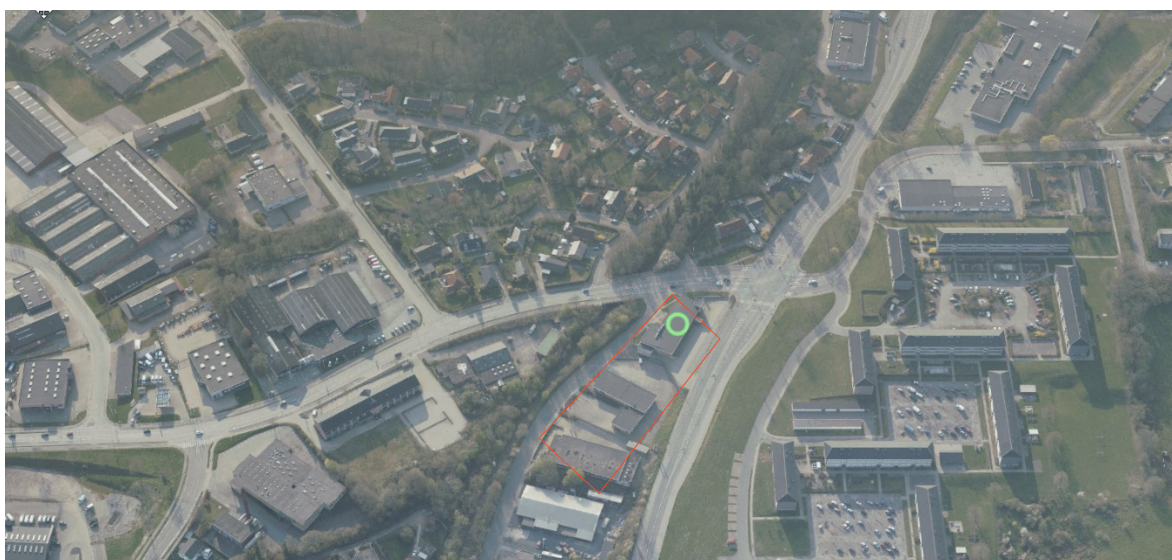
Luftfoto over ankomsten til Aabenraa fra Løgumklostervej. Lokalplanens område er antydet med rød afgrænsning og den eksisterende dagligvarebutik er markeret.

Lokalplanområdet ligger på en skrånende grund, med en terrænforskel på op til 5,5 meter. Der er opført en støttemur der optager terrænspringet mellem de to matrikler som udgør lokalplanområdet. Tankanlægget placeres på den østlige del af grunden som hæves til samme niveau som den vestlige del, hvor den eksisterende dagligvarebutik er placeret. Den eksisterende støttemur fjernes og der etableres en ny i lokalplanområdets østlige del, som vist på skitsen i lokalplangrundlaget. Den østlige del af lokalplanområdet vil således komme til at ligge i nogenlunde samme niveau som Løgumklostervej.