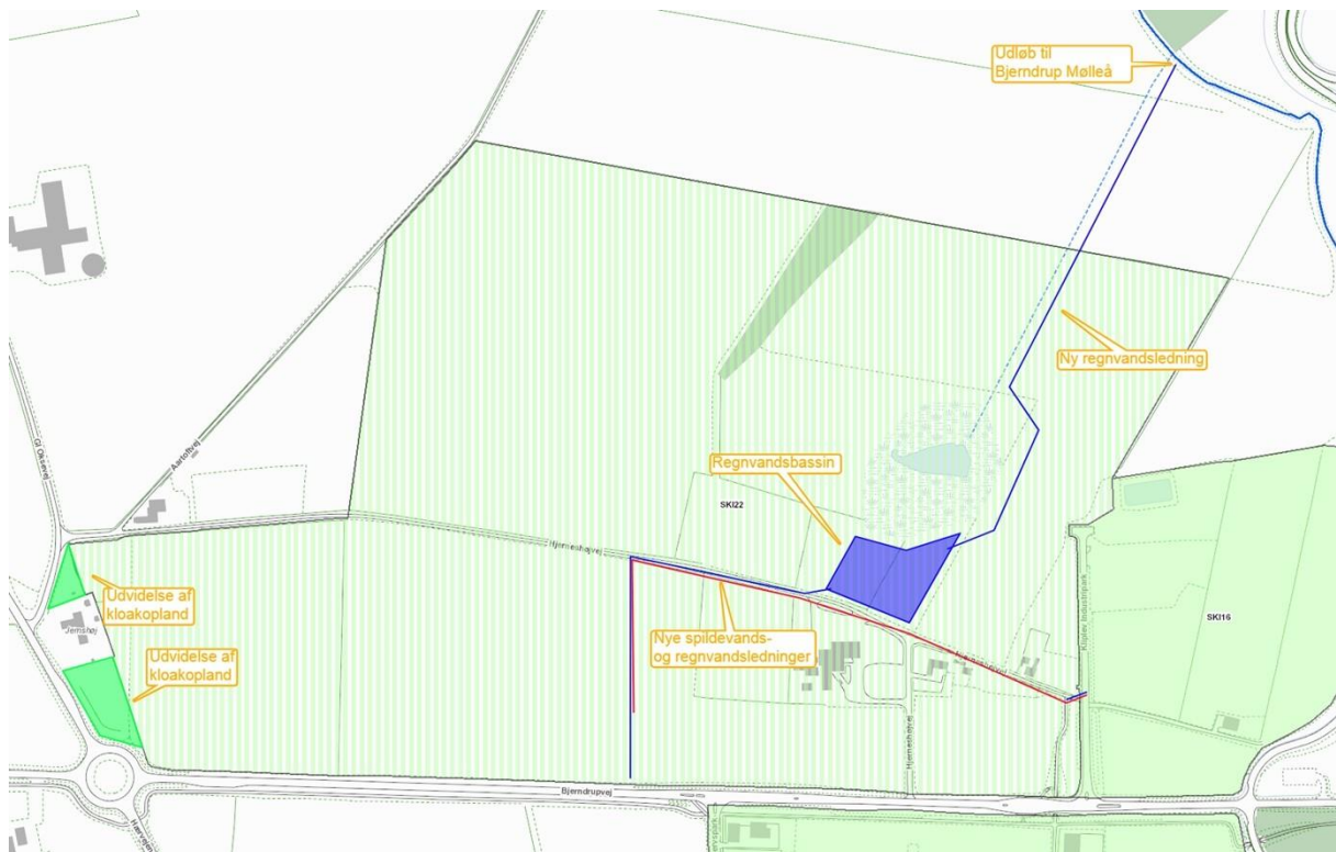
Figur 1 – Oversigtskort for Tillæg nr. 2 til Spildevandsplan 2018-2022

Figur 1 viser afgrænsningen af det planlagt kloakerede opland SKI22 samt placering af regnvandsbassin.