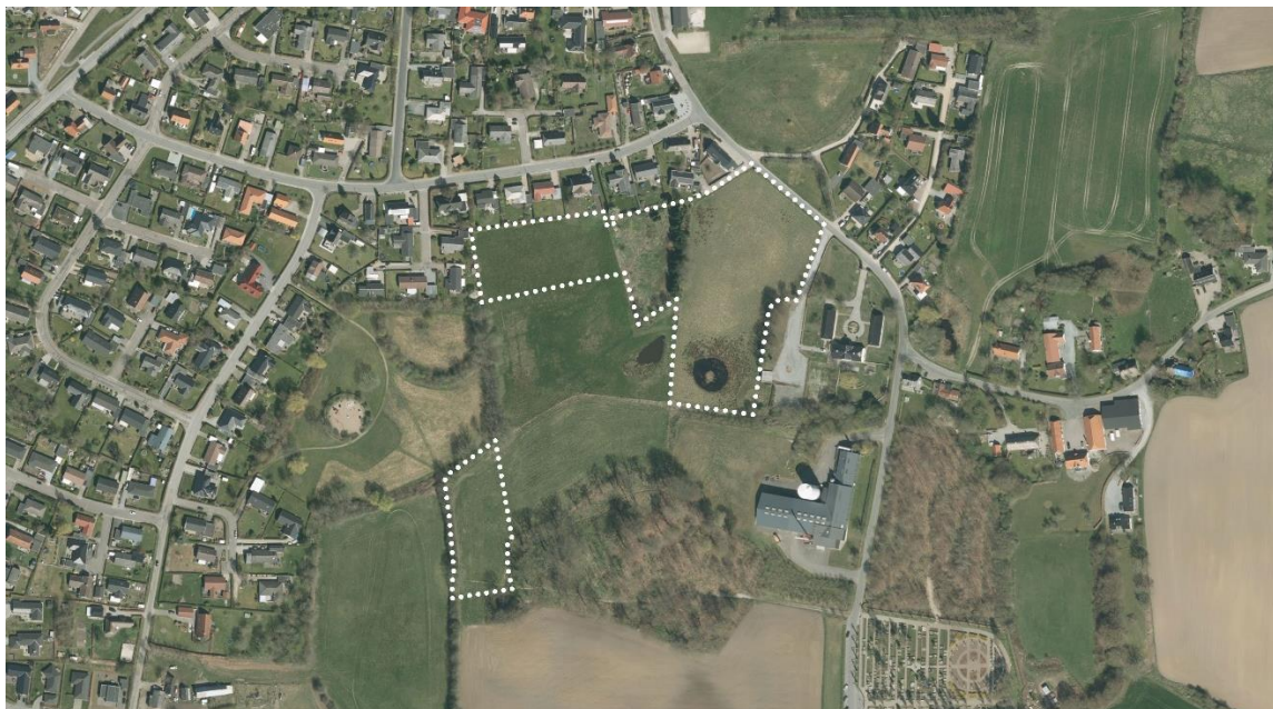
De aktuelle områder

Området er ca. 2,6 ha stort. Det er beliggende i byzone, men uden for kommuneplanrammer. Der er ikke en lokalplan for området. 0,6 ha af området ejes af Aabenraa Kommune. Udlæg af de pågældende byzonegrænser strækker sig formentlig helt tilbage til da Danmark blev opdelt i by- og landzone omkring 1970.