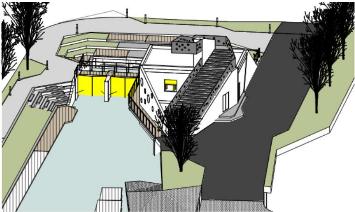
Figur 3: området fra syd