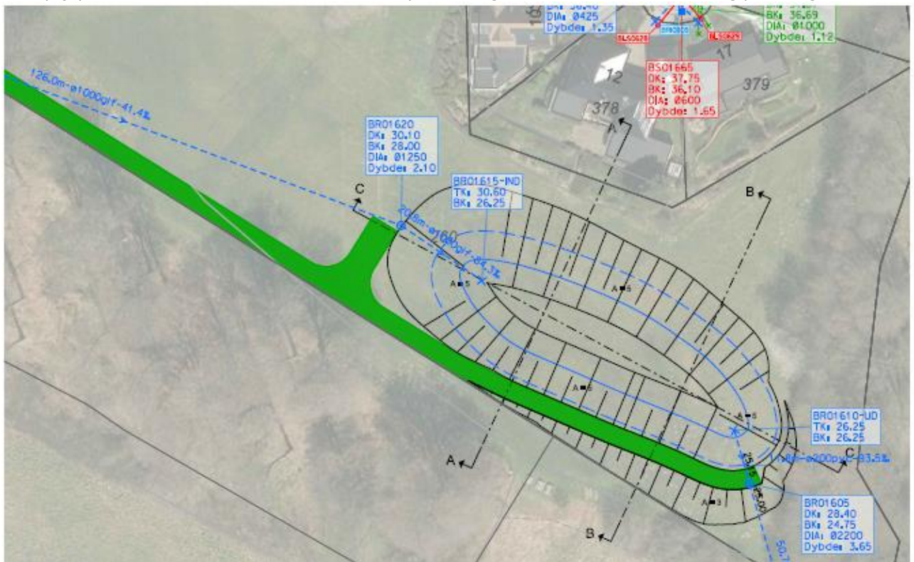
Skitse 2. Regnvandsbassin med en arealmæssig udbredelse ved permanent vandspejl på 973 m 2 og ved maksimalt vandspejl på 1989 m 2 . Det har et udløb til vandløbet på 36 l/s og terrænet etableres med anlæg på 1:3 og 1:5.