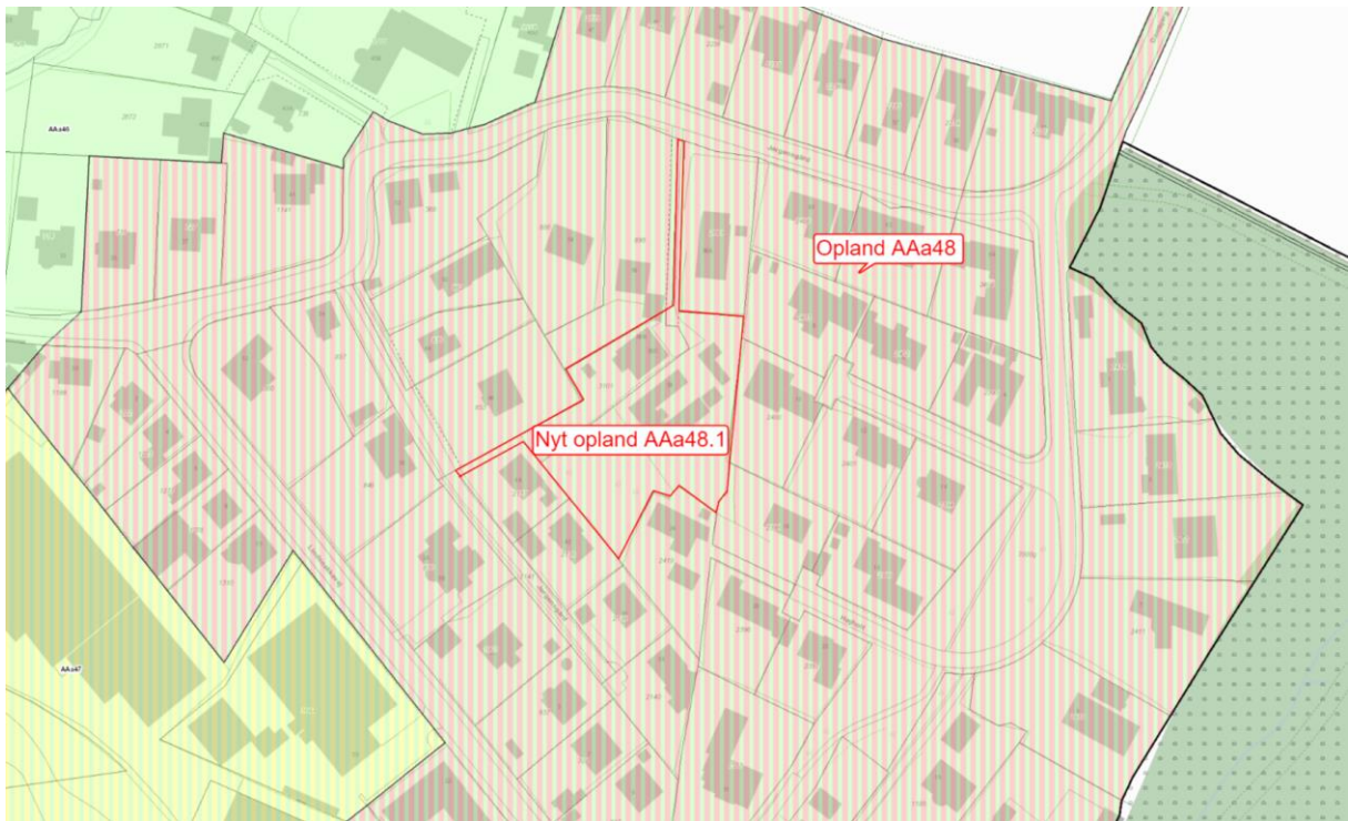
Figur 1-2: Oversigt kort over ændring i kloakopland AAa48

Tillægget opdeler desuden kloakopland AAa48, beliggende ved Jørgensgård mv. i Aabenraa By, som i Aabenraa Kommunes Spildevandsplan 2018-2022 blev planlagt separatkloakeret. I det nye kloakopland AAa48.1 ophæves planen om separatkloakering, og oplandet forbliver fælleskloakeret. Denne ændring foretages, da en separatkloakering af ejendommene i det kommende opland AAa48.1 har medført tekniske udfordringer, hvor den planlagte metode til separeringen ikke kan udføres uden store risici for skader på og sammenstyrtning af nærliggende trapper og støttemure. En alternativ separering med pumpeløsninger til både regnvand og spildevand vil medføre store omkostninger i forhold til gevinsten ved en separatkloakering. Det er vurderet, at spildevandssystemet kan håndtere overfladevandet fra oplandet grundet gode faldforhold og kapacitet i den kommende spildevandsledning.