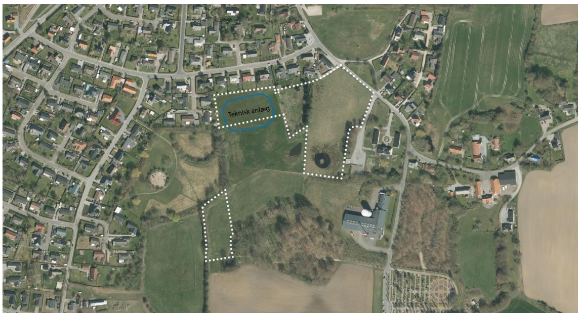
De aktuelle områder samt teknisk anlæg til regnvandsopsamling

Områderne udgør til sammen ca. 2,6 ha. De er beliggende i kanten af byzonen, men uden for kommuneplanrammer. Der er ikke en lokalplan for områderne. 0,6 ha af områderne ejes af Aabenraa Kommune. Udlæg af de pågældende byzonegrænser strækker sig formentlig helt tilbage til da Danmark blev opdelt i by- og landzone omkring 1970.