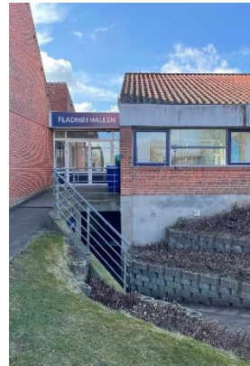
Områdebilleder, Fladhøj Idrætscenter