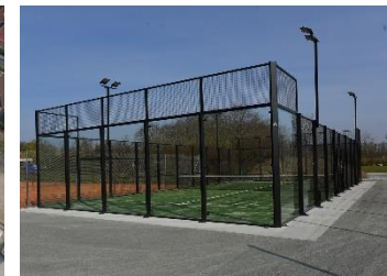
Etablering af beach- og padelbaner.