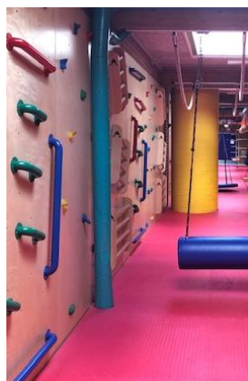
Områdebilleder, Fladhøj Idrætscenter