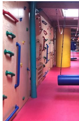
Områdebilleder, Fladhøj Idrætscenter