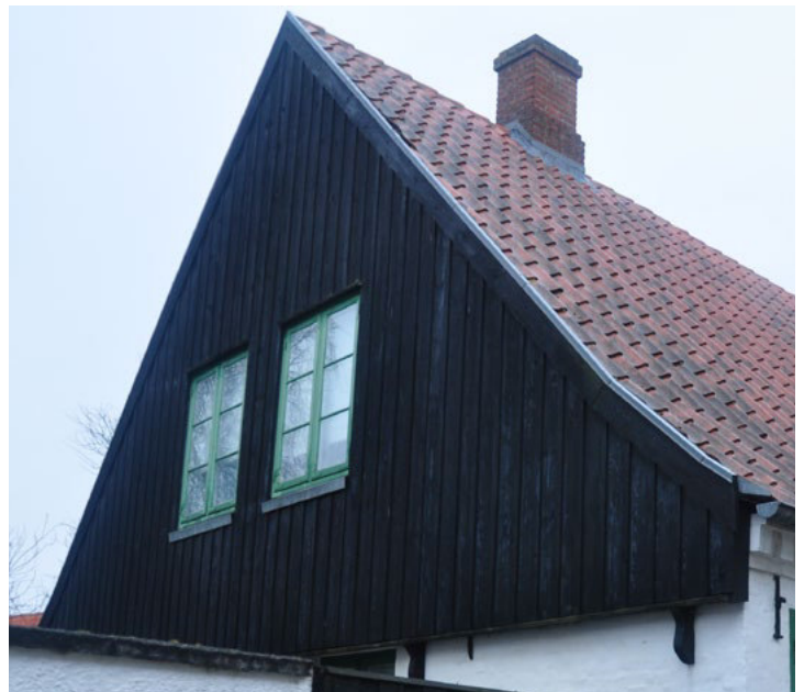
Lille Pottergade 4. Lodret brædebeklædning en-på-to, med enkelt sugfjæl/vindskedebrædt og vandbrædt over den murede gavfacade, der bæres af profilerede konsoller i træ.