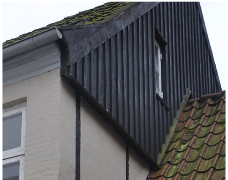
Skibbrogade 20. Listebeklædt gavl over bindingsværksmur. Enkelt sugfjæl/vindskedebrædt er skæet i profil der følger gesimsen på hovedhuset.