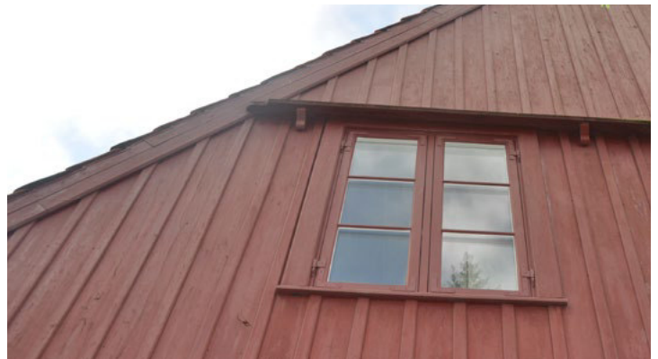
Slotsgade 24. Listebeklædt gavl med enkel sugfjæl/vindskede og vandbrædder over vinduerne båret af konsoller.