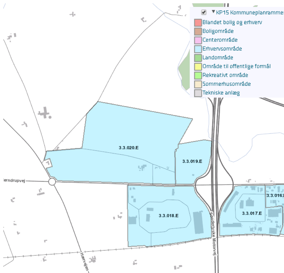
Figur 2: Uddrag af Kommuneplan 2015-2026 for det vestlige Kliplev.

Kloakoplandet optages i spildevandsplanen i henhold til gældende kommuneplan. Tillæg nr. 2 til Spildevandsplan 2018-2022 strider derfor ikke imod den gældende kommuneplan. Figur 2 viser nutidige og fremtidige arealanvendelser for det vestlige Kliplev.