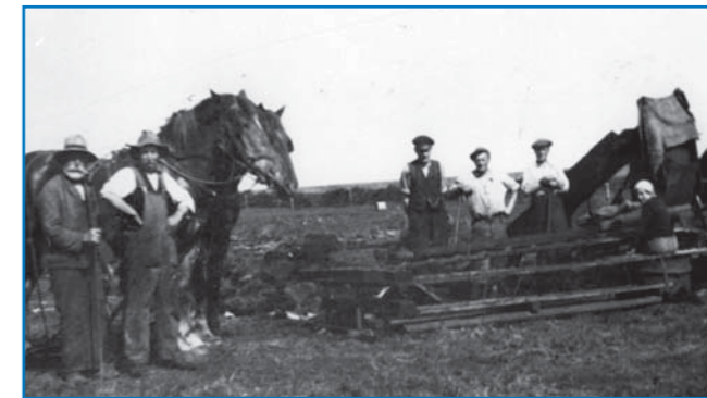
Tørvegravning under krigen 1940-1945

Moserne udgør en af Sønderjyllands væsentlige naturtyper. En betragtelig del af Sønderjylland har indtil for et par hundrede år siden været dækket af moser. Siden er der gravet tørv til brændsel, og moserne er afvandet for at skaffe landbrugsjord.