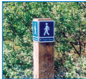
Stien er afmærket med dette skilt