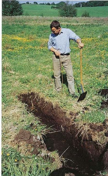
Gravning af prøvehul

Om der er plads til et lille eller stort vandhul er af mindre betydning. Dog er et lille vandhul mere følsomt over for tilgroning og påvirkninger udefra end et stort.