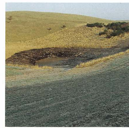
- og efter