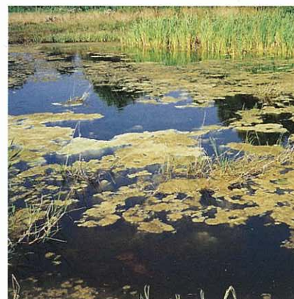
For mange næringsstoffer