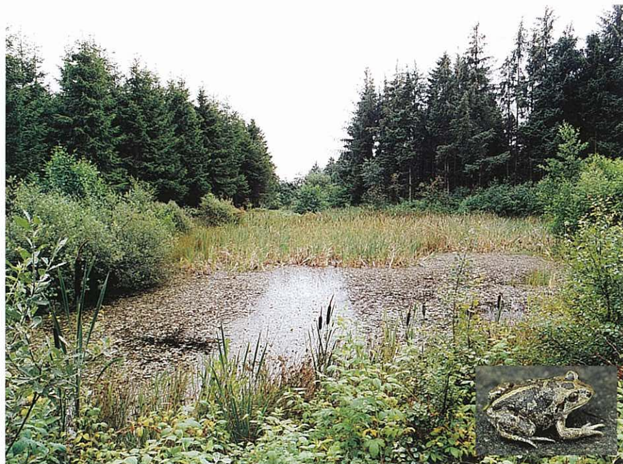
Et godt vandhul for f.eks. løgfrøer

Sprøjtning er en meget dårlig idé af hensyn til miljøet og de dyr og planter, man gerne vil have ved vandhullet.