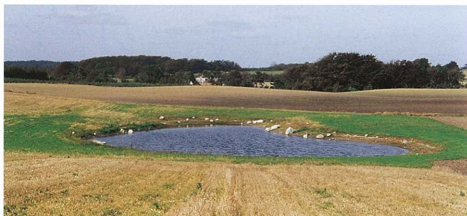
Nyt vandhul med dyrkningsfrie bræmmer

Vær opmærksom på, at udsætning og fodring i vandhuller ofte kræver en særlig tilladelse.