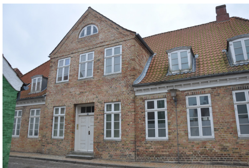
Slotsgade 33, omk. 1748. Fin klassicistisk symmetri med let fremtrukket gavlkvist med trekantfronton, rundbuet vindue i gavlkvisten og høje smalle vinduer. Symmetrien er formentlig skabt ved ombygning omkring 1850.