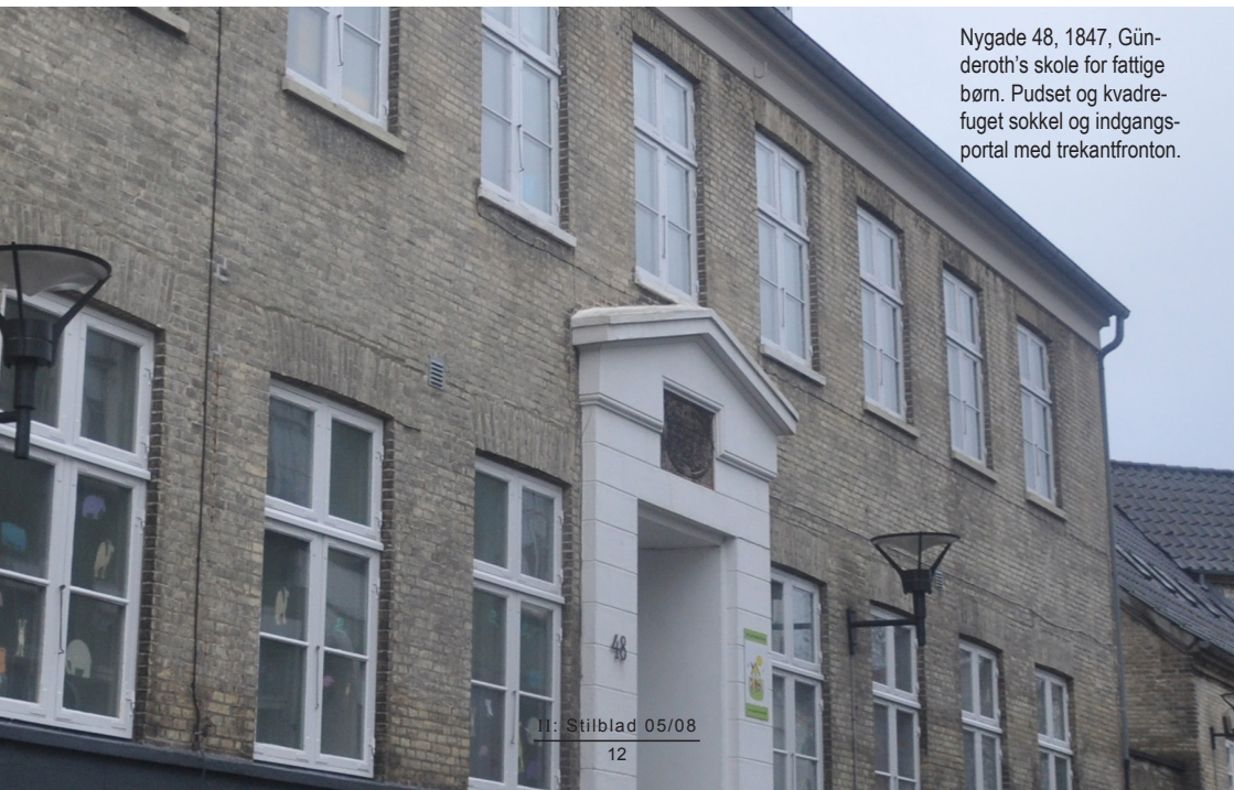
Nygade 48, 1847, Gundersen's skole for fattige børn. Pudset og kvadre-fuget sokkel og indgangsportal med trekantfronton.

Farvesætning af dit hus' facader, døre og vinduer bør ikke ændres uden tilladelse fra kommunen, og hvis huset er fredet fra Slots- og Kulturstyrelsen. Du kan finde inspiration til farvesætning og holdninger i Bevaringsplanen fra 1975, blandt de øvrige huse i byen eller ved farveundersøgelser på dit hus.