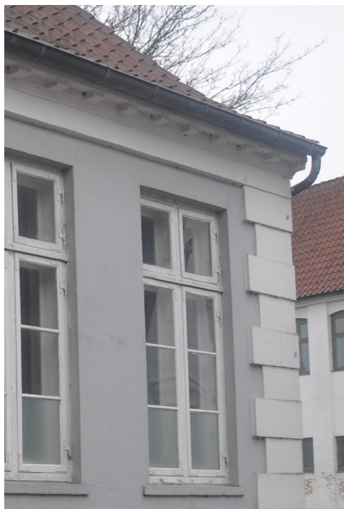
Klinkbjerg 2, med sparekopesims som afslutning mod taget og kvadrefugede hjørnelisener.

Med klassicismen kommer det klassicistiske vindue, i forhold efter det gyldne snit; 8:13. Lodposten er spinklere og rammerne er kun vandret sprosseopdelt, vinduerne havde således relativt store ruder, der ikke måtte være i lavformat.