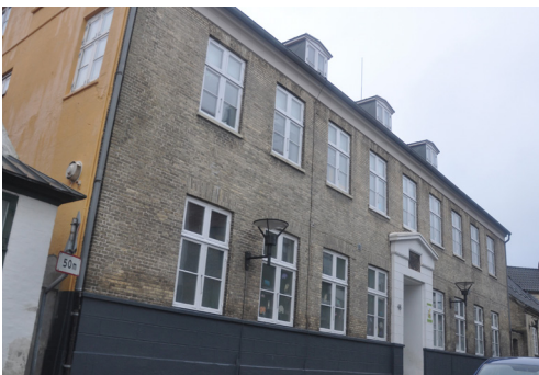
Nygade 48, 1847, Günderoth's skole for fattige børn. Pudset og kvadrefuget sokkel og indgangspotal med trekantfronton.