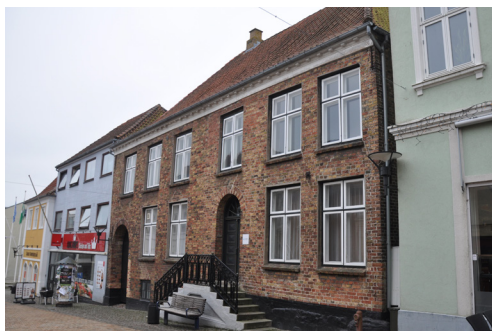
Storegade 24, før 1744. Klassicistisk formsprog med tydelige klassicistiske træk: sparekopesims samt rundbuede åbninger ved dør og port.