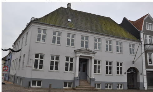
“Redergården”, Storetorv 9, et fornemt eksempel på klassicismen. Pudsede murflader, sparekopesims mod taget, og portal med klar inspiration fra antikken; søjler der bærer en trekantfronton. Udtrykket stammer fra en ombygning i 1825.