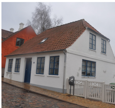
Persillegade 7, 1855. Har enkle senklassicistiske træk, med de pudsede vinduesindfatninger samt hoveddøren med fyldninger.