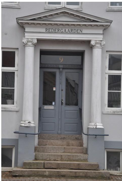
Klassicistisk dørportal, Redergården, Storetorv 9. Søjlebåret trekantfronton.

Redergården, Storetorv 9, er et fornemt klassicistisk eksempel på en ombygget facade med høje vinduer, sparekopesims mod taget samt en fin antikinspireret søjleportal, der bærer en trekantfronton.