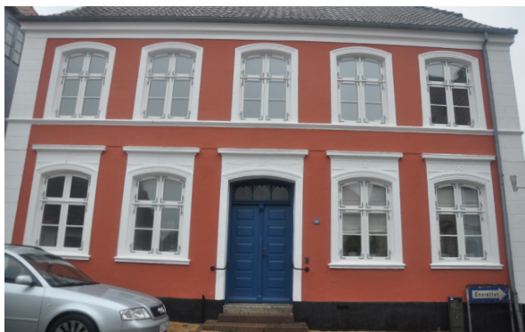
Nygade 59, før 1852, med klare senklassicistiske træk: pudsede murflader, kvadreoptrukne hjørnelisener, gennemgående vinduessålbænk og hovedgesims samt fladbuede vinduesindfatninger, med overbygninger i stueetagen. Hoveddøren er med fyldninger.