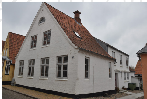
Slotsgade 17. Mellem 1821-25 er gavlen og de tre fag nærmest gaden nyopført efter klassicistisk inspiration, idet det oprindelige bindingsværkshus fra de tidlige 1700år eller før, blev forøget i bredden, fik større vindueshuller og halvrundt vindue i gavlkvisten.

I barokken, rokokoen og Louis Seize-perioden er inspirationen fra udlandet tydeligst i detaljerne, eksempelvis i dørenes detaljering. I klassicismen og senklassicismen ændres byggetraditionen markant. Dette ses ved ændringer i facaderudtrykket, nye overfladebehandlinger, kompositioner og byggemetoder.