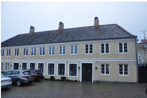
Kirkepladsen 8, den gl. pigeskole, er opført i 1737, men er forhøjet mod kirkepladsen til to etager i 1853-55, og har senklassicistiske træk med cordongesims og trukne pudsede vinduesindfatninger.