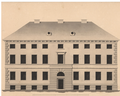
C.F. Hansens tegning til Vajsenhus i Altona, Königstrasse 149, fra 1794. Klare klassicistiske træk som også ses på Aabenraas rådhus.

Begyndende klassicistiske træk ses også på 'Det gamle Pakhus', Skrænten 50, fra 1827. Her i form af en enkel og velproportioneret bygningskrop med kurvehangsformede åbninger ved porte og døre samt flade murede etagebånd.