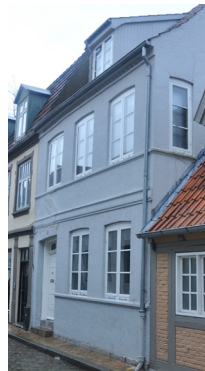
Store Pottergade 3, 1865. Med cordongesims og sålbænk-bånd.