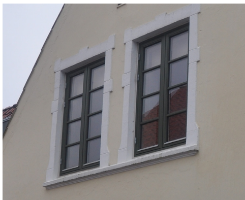
Nygade 31, før 1744. Facaden mod Nygade ommuret i 1845-55. Vinduesindfatninger i puds og delt vinduessålbænk