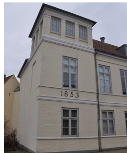
Søndergade 24, 1853. De pudsede murflader og gennemgående profilerede bånd og gesims er senklassicistiske træk. Mens husets form med tårn peger mod nye tider.