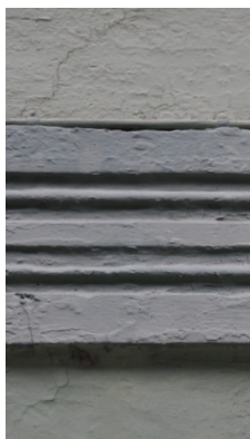
Skibbrogade 1, 1857, cordongesims.

I Aabenraa findes der indtil flere helstøbte senklassicistiske facader. Et eksempel herpå er vnes