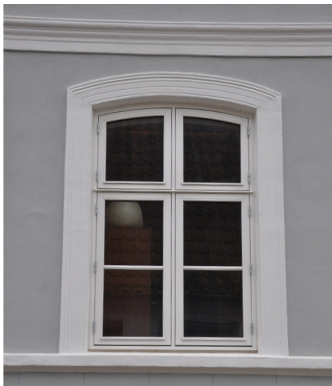
Skibbrogade 13, gennemgående vinduessålbænk, rundbuget vindue og indfating trukket i puds.

Overgangen fra klassicismen til den senklassicistiske periode kendetegnes således ved den