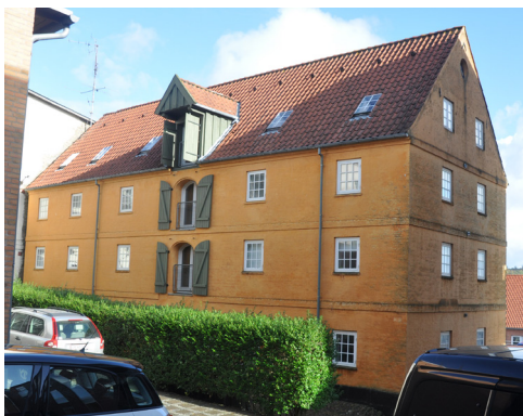
Det gamle pakhus, Skrænten 50, 1827, har enkelte klassicistiske træk som kurvehangsbuede port- og døråbninger samt flade uprofilerede etagebånd.

der fra 1821-25 får tre nye fag mod gaden, som er tydeligt inspireret af klassicismen med bl.a. et rundbuet vindue i gavlkvisten. Tidligere har gavlen også haft et rundbuet dørhul. Huset bliver efter ombygningen ligeledes bredere i grundplan end det oprindeligt har været. Dette kan skyldes nye krav til indretningen, men også hensynet til proportionerne, hvor den brede gavl klæder det klassicistiske formsprog.