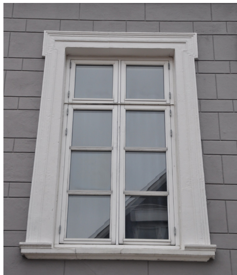
Ramsherred 45, højt smalt vindue med tempelagtig vinduesindfating.