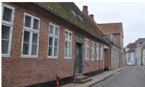
Slotsgade 31, opført mellem 1785-88, markerer overgangen mellem 1700-tallets murede byggeri og klassicismen. Med facadens enkle udtryk, proportioner og de halvvalmede gavle slås de klassicistiske toner fornemt an.