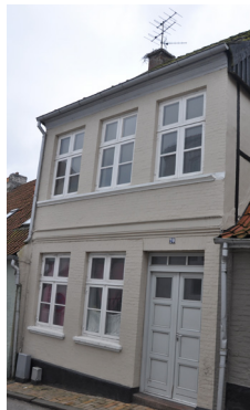
Skibbrogade 20, 1856. Har cordongesims og sålbænk-bånd.