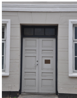
Slotsgade 35, 1825. Pudset senklassicistisk facade med renefduget murflade og pudsede vinduesindfatninger.