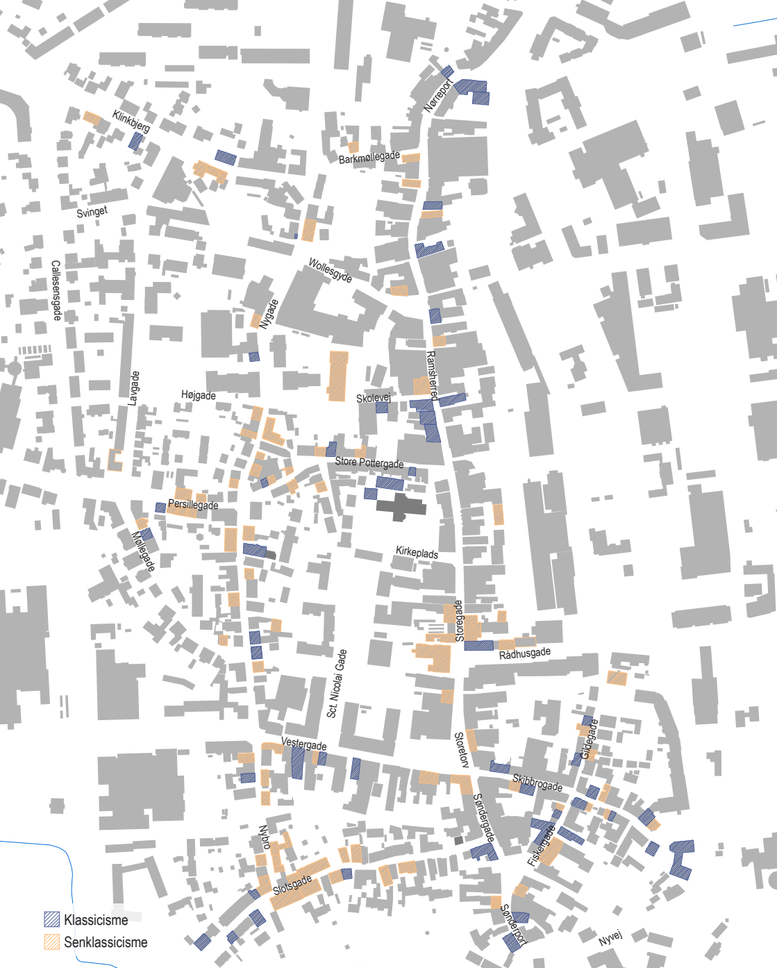
Klassicisme og senklassicisme i Aabenraa. På kortet vises bebyggelser med gennemgående klassicistiske og senklassicistisk træk.