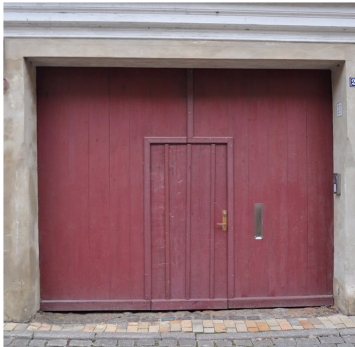
Slotsgade 24. Bred port med adgangsdør i midten. Hvis revleporte slår revner kan man påsætte lister over revnerne.

Nyt træ og blottet træ hvor maling er afrenset, bør behandles med rå linolie, som en vandafvisende imprægnering, inden delene samles. Mere om maling og overfladebehandling på særskilt vejledningsark.