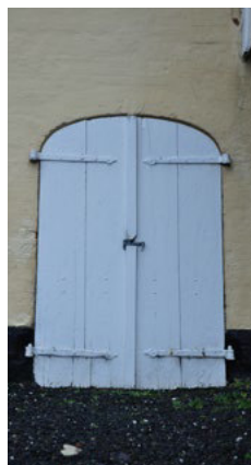
Ramsherred 45c. Mindre port/luge med udvendige stabler og båndhængsler.