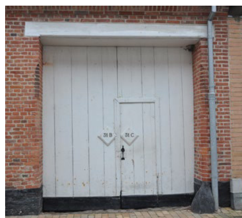
Slotsgade 31. Tofløjet port med adgangsdør i den ene portfløj. Bemærk portoverligger i tømmer og de fint affasede hjørner i murværket.