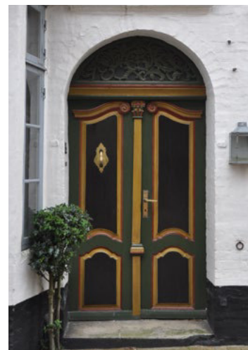
Slotsgade 29, 1770. Fyldningsdør med svungne profiler og sirligt udskåret overvindue.