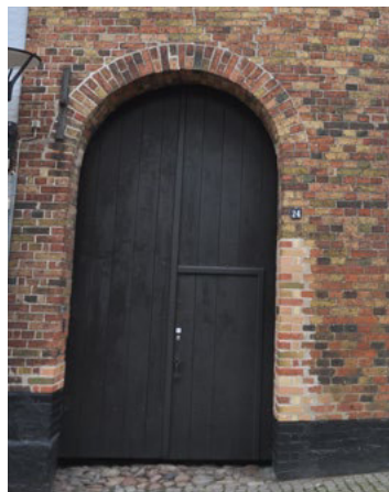
Storegade 24. Tofløjet port med adgangsdør i ene portfløj