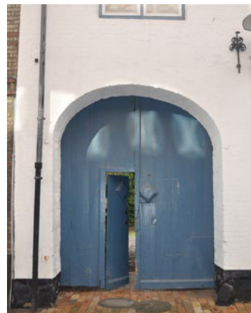
Skibbrogade 8. Tofløjet port med adgangsdør i ene portfløj