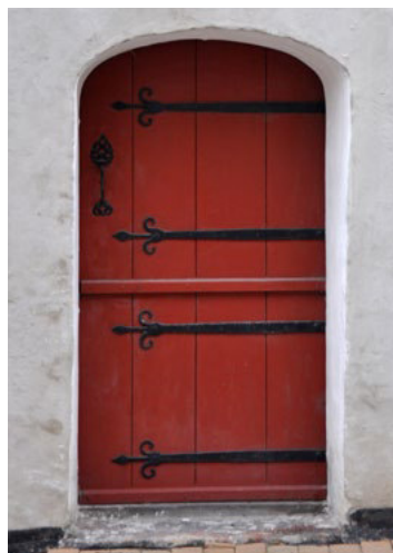
Gildegade 5. Nyere men traditionelt udført todelte revledør med smedede båndhængsler med bukkehorn.