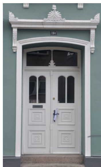
Nybro 12. Historicistisk dør med stort overvindue og glas i dørløjerne.