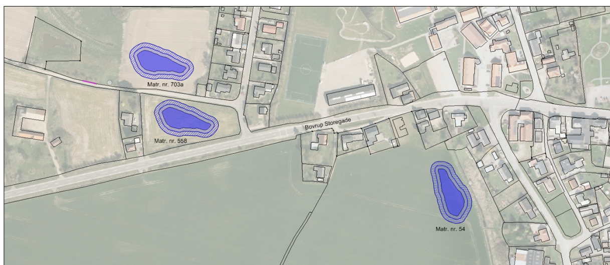
Figur 4-2 Mulige bassinplaceringer

I Forslaget til Tillæg nr. 8 er flere mulige bassinplaceringer undersøgt. På nedenstående kort ses de mulige bassinplaceringer, der blev arbejdet med. I forbindelse med den offentlige høring og behandling af tillægget er placeringen fastlagt til matrikel 558. De berørte matrikler er beskrevet i Tabel 8 i Bilag 2.