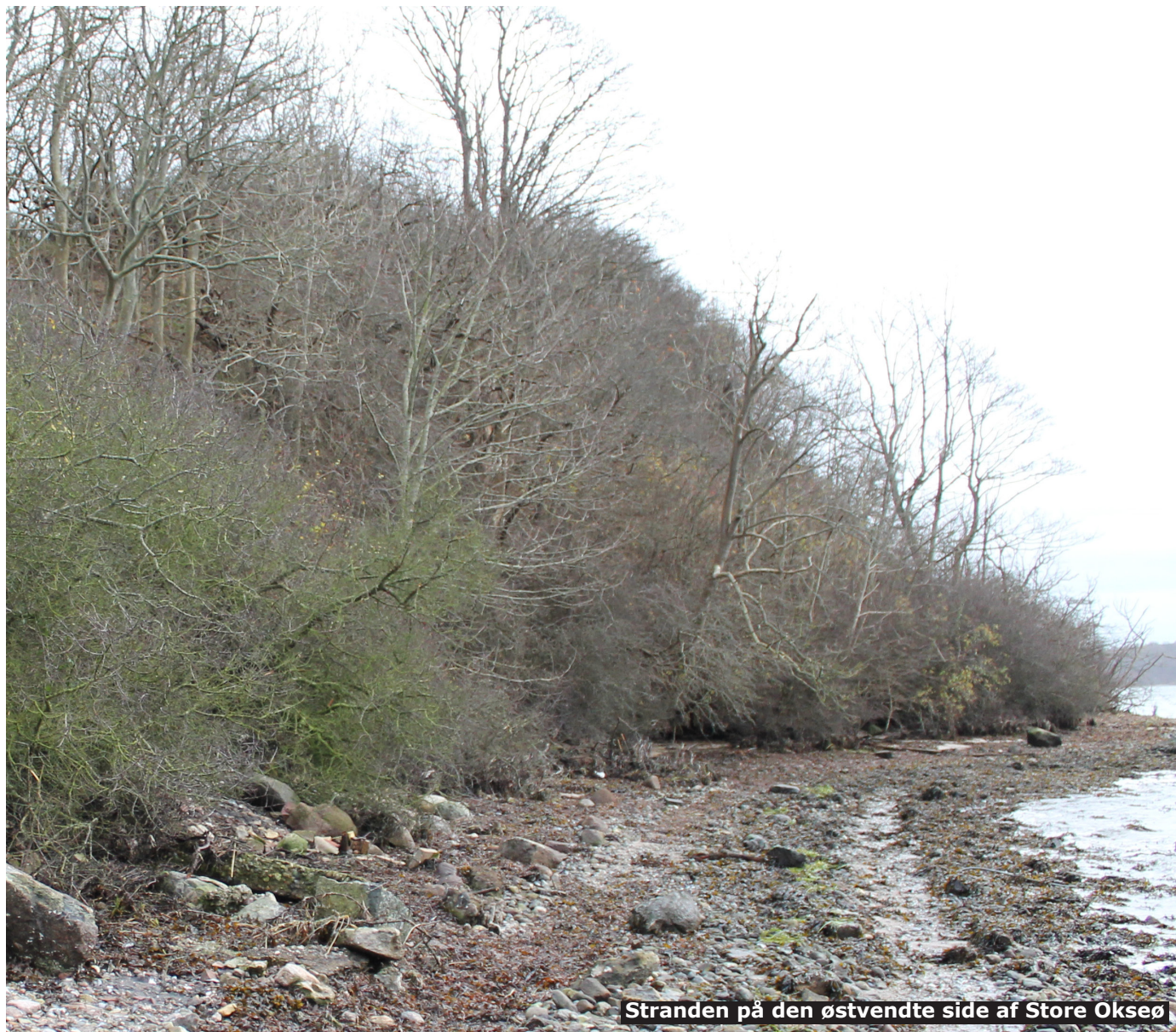
Stranden på den østvendte side af Store Okseø

Lokalsamfundet har Store Okseø forankret i identiteten, og der har været stor interesse i fremtidsplanerne for øen. Udviklingsperspektivet er udarbejdet som en naturlig forlængelse af det oprydningsarbejde som Naturstyrelsen og Aabenraa Kommune har indgået samarbejde om. Store Okseø rummer en unik naturoplevelse, som skal understøttes bedst muligt, til gavn for lokalområdet og de besøgende.