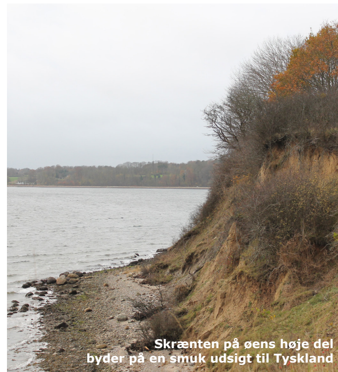
Skrænten på øens høje del byder på en smuk udsigt til Tyskland

Der er et stort potentiale i øen som udflugtsmål for forskellige målgrupper, og dette kan med forholdsvis få indsatser understøttes yderligere. Derfor tager udviklingsperspektivet udgangspunkt i, at Store Okseø ikke skal være lokalitet for større udviklingsprojekter, dette er dog ikke til hinder for, at der kan etableres mindre faciliteter på øen med formål at understøtte forskellige brugergrupper.