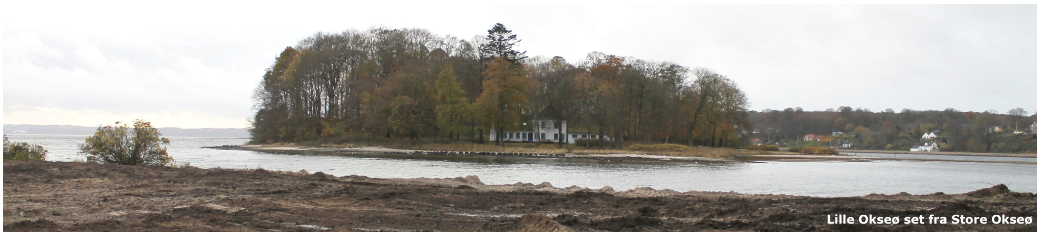
Lille Okseø set fra Store Okseø