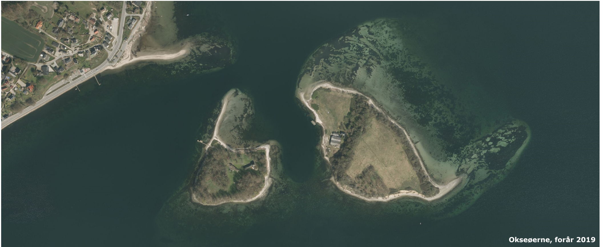
Okseøerne, forår 2019