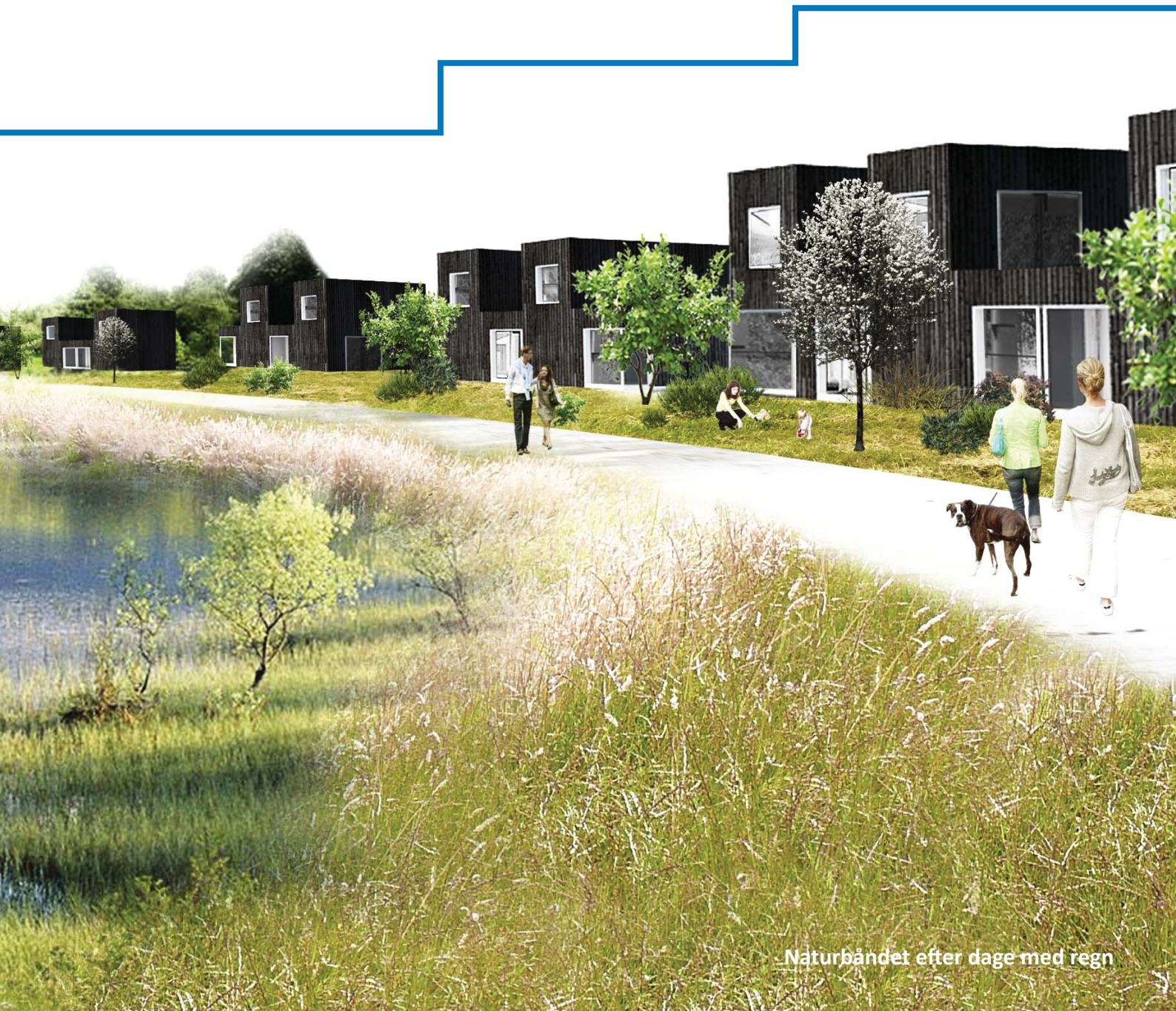
Naturbåndet efter dage med regn